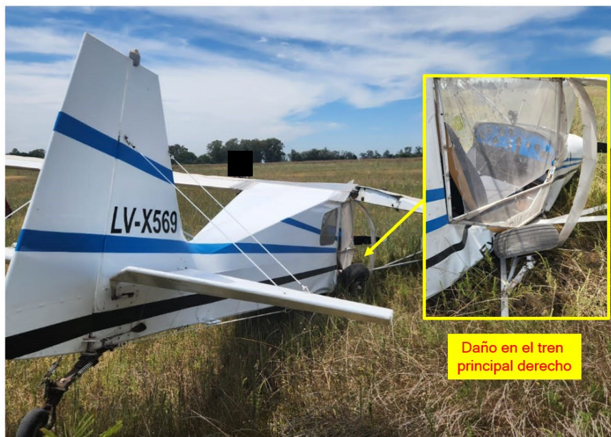
Figura 2. Daño en el tren principal derecho.

En ese momento, la aeronave mantenía parámetros de velocidad y altitud compatibles con una operación normal y se encontraba alineada con el eje de pista. Sin embargo, ante la presencia de una línea de árboles en la trayectoria de aproximación y la falta de potencia en el motor, el piloto desvió el rumbo para realizar un aterrizaje de emergencia en un campo cercano. Durante la toma de contacto, el tren principal derecho colapsó y la aeronave se desplazó unos 20 metros hasta detenerse. No se produjo dispersión de restos.