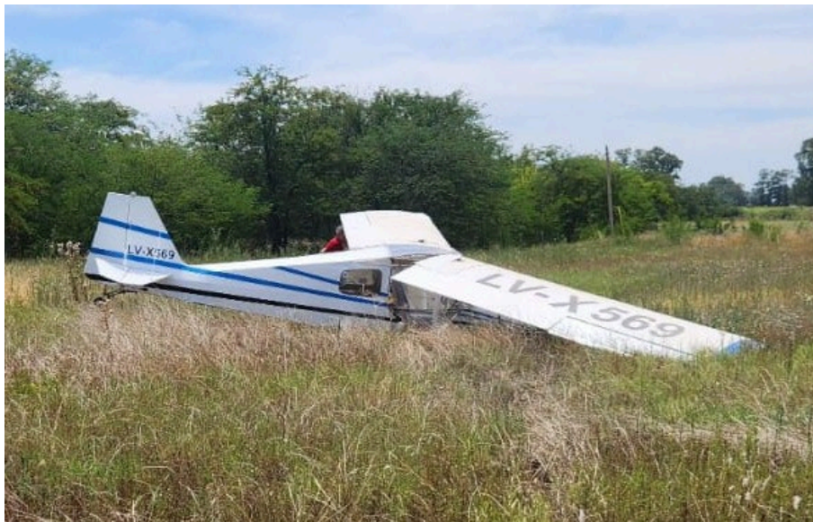
Figura 1. Posición final de la aeronave LV-X569.

Como consecuencia del suceso, la aeronave resultó con daños en el tren de aterrizaje y en el plano alar. El piloto y el pasajero descendieron de la aeronave por sus propios medios, sin lesiones.