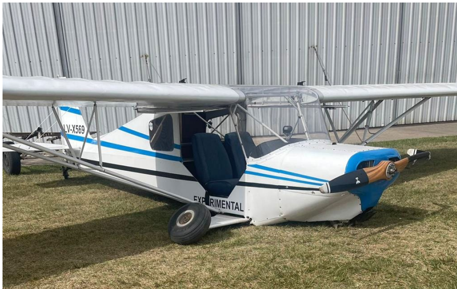
Figura 5. Daños en tren de aterrizaje principal y hélice producto del suceso de 2022.

Cabe señalar que el 1 de octubre de 2022, la aeronave tuvo una excursión de pista en el mismo aeródromo que resultó en daños en el tren de aterrizaje principal y la hélice.